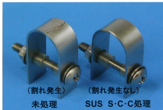
図1 応力腐食割れ試験片の外観

特に長年に渡るステンレス業界の宿命とも言うべきオーステナイト系ステンレス鋼の応力腐食割れ(SCC)防止に特効のあることが立証されるに至り、稼働中のプラントや機器類の保守、点検時に気軽に実施すれば、恐れられていたSCCの完全防止にその活用が大きく期待されます。(図1)