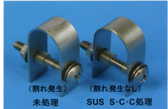
図1 応力腐食割れ試験片の外観

特に長年に渡るステンレス業界の宿命とも言うべきオーステナイト系ステンレス鋼の応力腐食割れ(SCC)防止に特効のあることが立証されるに至り、稼働中のプラントや機器類の保守、点検時に気軽に実施すれば、恐れられていたSCCの完全防止にその活用が大きく期待されます。(図1)