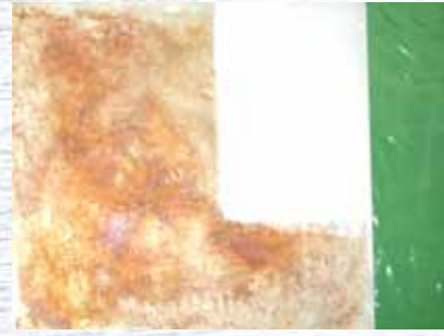
ステンレス特有の輝きはそのまま 効果は歴然プロフェッショナル仕上げ

喰い込んだサビも強力に除去します。市販されている刷毛で塗り、15~30分待って返し塗りをするとより効果的。