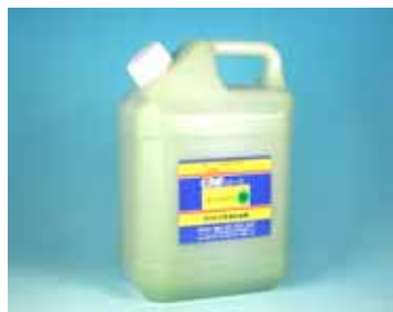
ピカ素# SUS300 - W 一般用

あらゆるステンレス製品のもらいサビやシミ、汚れ取りに! 塗布方式の強力ペースト型