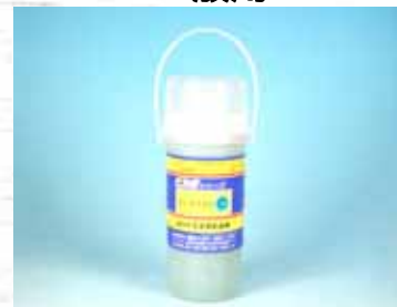
ピカ素# SUS300 - C 一般用

W、S型で取りきれない頑固なサビ、汚れ取りに有効な強力型水でぬらした布で拭き上げるように使用。(専用のゴム製ワイパーがあります)