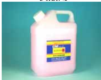
ピカ素# SUS300 - S 食品用

あらゆるステンレス製品のもらいサビやシミ、汚れ取りに! 塗布方式の強力ペースト型