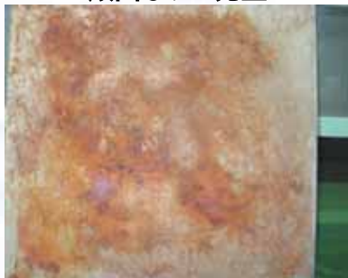
錆びないと思っていたら錆びた 頑固なサビ発生

ステンレス300系(磁性のないもの)の頑固なサビ取り、指紋、靴痕などの汚れ取り! 酸洗剤の液ダレや電解焼け取り後のムラ解消にも有効です!